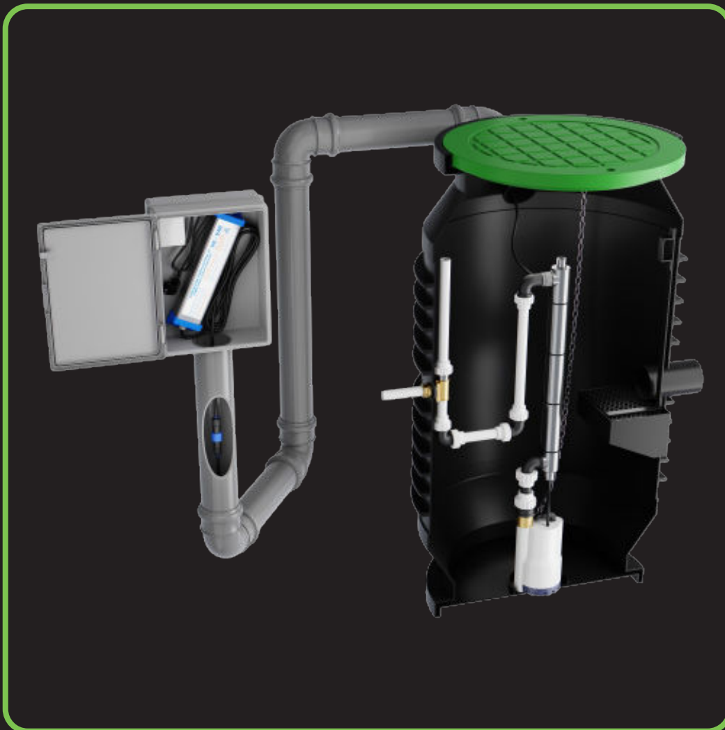
UV-brunn men tillhörande pump och styrskåp (röret på bilden mellan enheterna ingår ej)

UV-lampans lysrör har en brinntid på ca:9000 timmar och behöver bytas en gång/år, detta görs lämpligen vid årsservice då man även gör rent det inbyggda skyddsglasat.