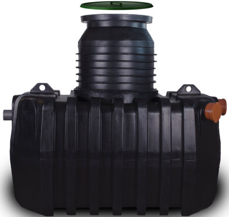
VÄNERN MEDIUM 2000