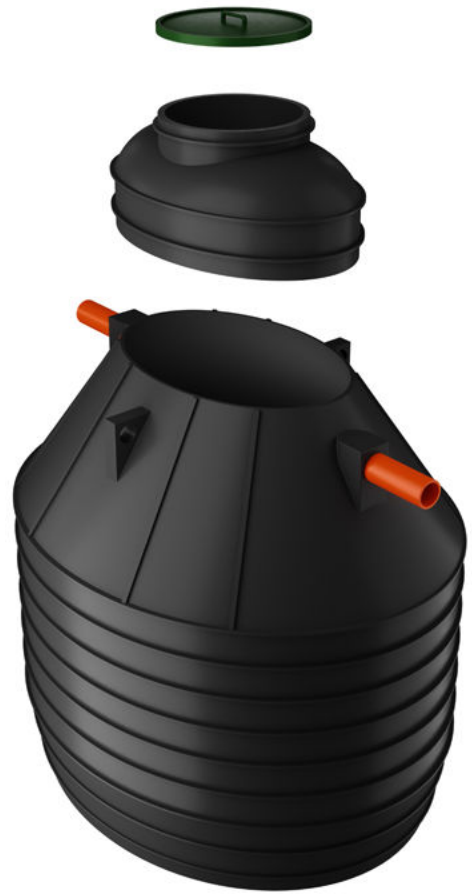
VÄNERN LÅG 5000

Tankarna seriekopplas vid större storlekar.