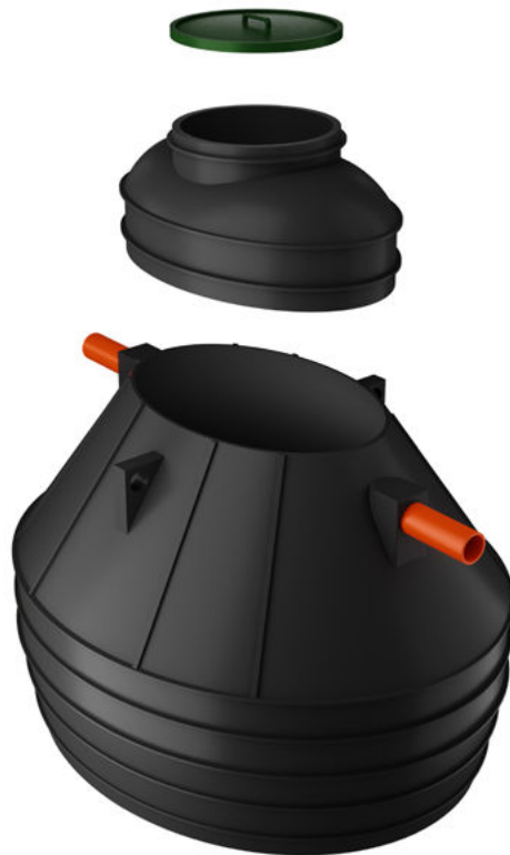
VÄNERN LÅG 3000