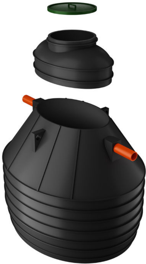
VÄNERN LÅG 4000