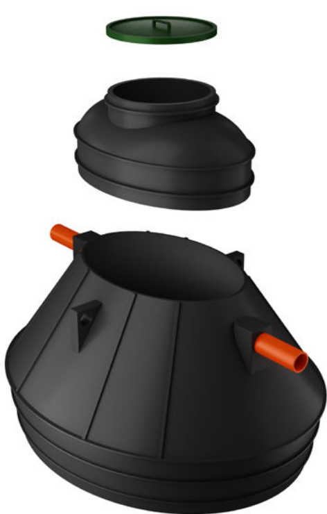
VÄNERN LÅG 2000