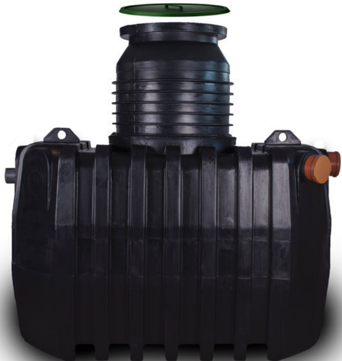
VÄNERN MEDIUM 2500